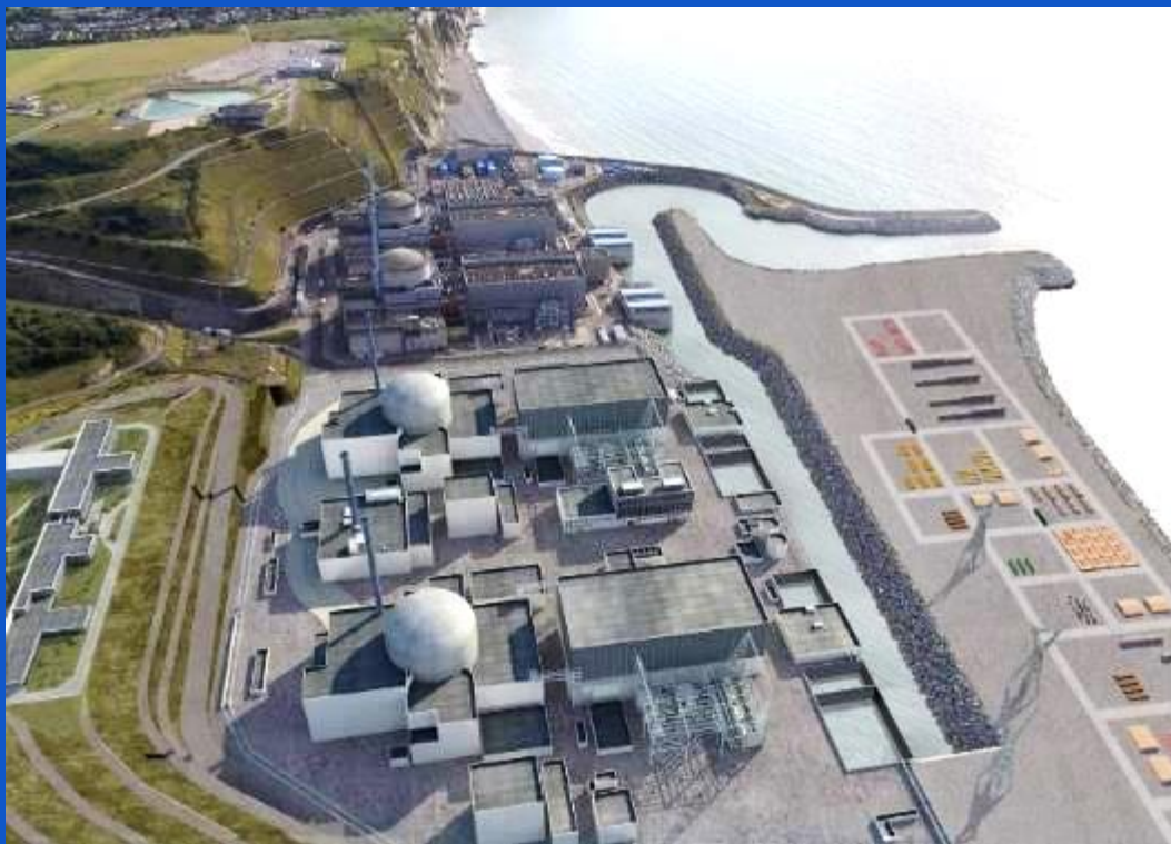
Simulation de la 1 ère paire d'EPR2 sur le site de Penly

Direction Ingénierie Direction Immobilier Groupe